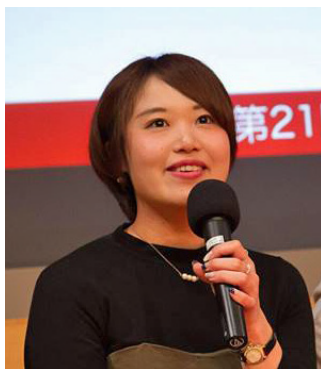
(株)中国新聞社勤務