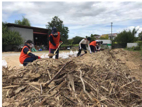
広島大学学生ボランティア団体 operation つながり団員